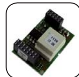
Interface RS485 485PB-NR