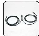
SMA Power Balancer Y Câble PBL-YCABLE-10