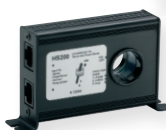
Steca PA HS200 Shunt