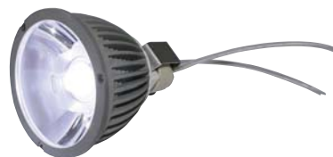
Les supports GU4/5.3 pour Steca ULED 3 (ressort de retenue grand) et Steca ULED 5 (ressort de retenue petit)