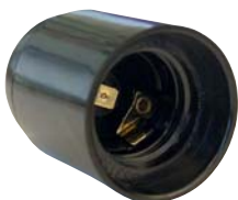
L'embase E27 pour Steca Solsum ESL et Steca ULED 11

Les douilles de lampes Steca permettent de monter toutes les ampoules Steca en un tournemain.