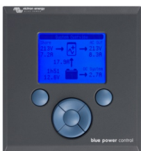
Tableau de commande Blue Power

Une solution pratique et bon marché pour une surveillance à distance, avec un bouton rotatif pour configurer les niveaux de Power Control et Power Assist.