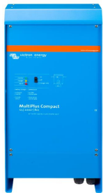
MultiPlus Compact 12/2000/80

Des logiciels sophistiqués (VE.Bus Quick Configure et VE.Bus System Configurator) sont disponibles pour configurer plusieurs fonctions nouvelles et perfectionnées.