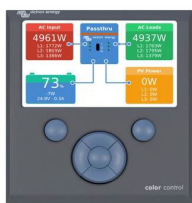
Color Control GX