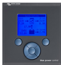
Tableau de commande Blue Power

Une solution pratique et bon marché pour une surveillance à distance, avec un bouton rotatif pour configurer les niveaux de Power Control et Power Assist.